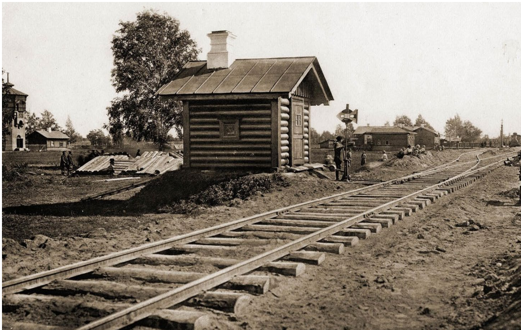
Фот. 1. ст. Каргат конец XIX века. Станция V класса Каргат. 1896 год. Слева Водонапорная башня 1886 г., рядом домик смотрителя.

С приходом Транссиба (конец XIX – начало XX века) поселение при станции стало перекрёстком людских потоков. Переселенческая политика и аграрные реформы начала XX века, активно заселявшие юг Западной Сибири, привели к росту населения и увеличению пашни. Каргат интегрировался в региональную экономику как пункт перевозки хлеба, муки, леса и скота.