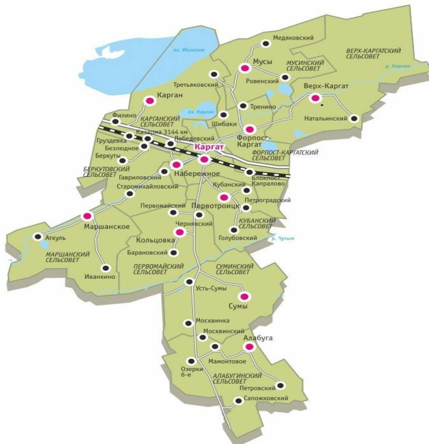
Рис.1 Административно-территориальное деление Каргатского муниципального района на поселения.

В административно-территориальный состав Каргатского района входят 10 сельских поселений (сельсоветов) и одно городское поселение. Общее количество населённых пунктов составляет 39 единиц (рис. 1, табл. 1).